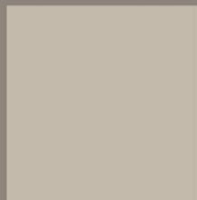
AVÓRIO - 60 - POLIDO IND. LISO, RT VAR. TONALIDADE: V1