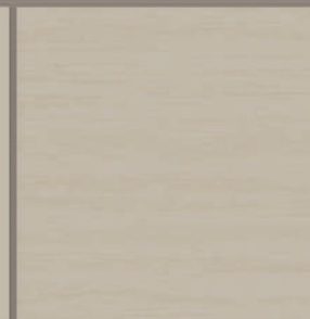
ÉVORA POLIDO 80 IND. LISO, RT VAR. TONALIDADE: V2