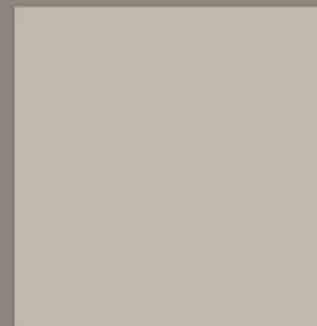
AVÓRIO POLIDO 80 IND. LISO, RT VAR. TONALIDADE: V1