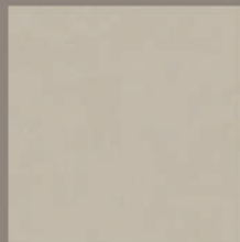
LISBOA - 60 - POLIDO IND. LISO, RT VAR. TONALIDADE: V3