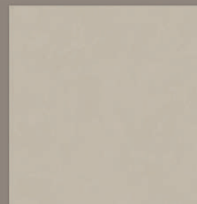
LISBOA POLIDO 80 IND. LISO, RT VAR. TONALIDADE: V3